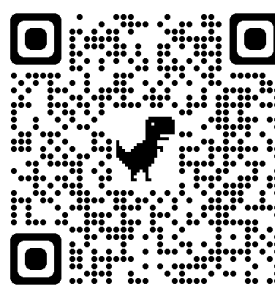
学科/専攻 YouTube チャンネル