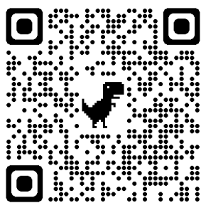
学科/専攻ホームページ

YouTube チャンネル： https://www.youtube.com/channel/UCTmoq1QPQ1Ho4nDBWo-yFGQ