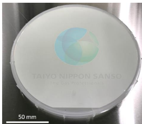
図 1 6 インチテストウエハ上に成膜した \beta -Ga 2 O 3 薄膜