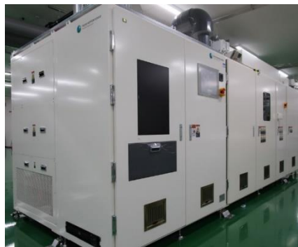
図2 開発した \beta -Ga 2 O 3 成膜向け6インチ枚葉式HVPE装置の外観写真

また、成膜条件の最適化や独自の原料ノズル構造の採用により、6インチテストウエハ上における \beta -Ga 2 O 3 成膜の実証、および \beta -Ga 2 O 3 膜厚分布 \pm 10\% 以下を達成するなど面内で均一な成膜が可能であることも確認しました(図3)。本成果で確立した大口径基板への成膜技術やハードウェアの設計技術により \beta -Ga 2 O 3 成膜装置のプラットフォームを構築できるため、大口径バッチ式量産装置の開発を大きく進展させることが可能となりました。これにより、 \beta -Ga 2 O 3 成膜プロセスおよびデバイスの適用による消費電力削減によって、2030年時点で21万kL/年程度の省エネルギー効果が見込まれています。