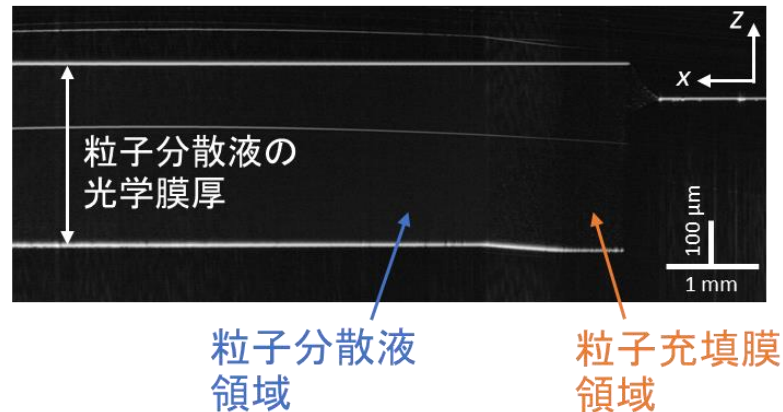
図 1 (上図)実験の概略図。赤色点線部分をスキャンして、蒸発端面近傍での分散液内の粒子濃度分布を計測した。(下図)OCT で得られた、乾燥中の粒子分散液内の断面画像。この画像を解析することで粒子濃度分布を定量化できる。図は Soft Matter, 2024, 20, 2381-2393 より改変。